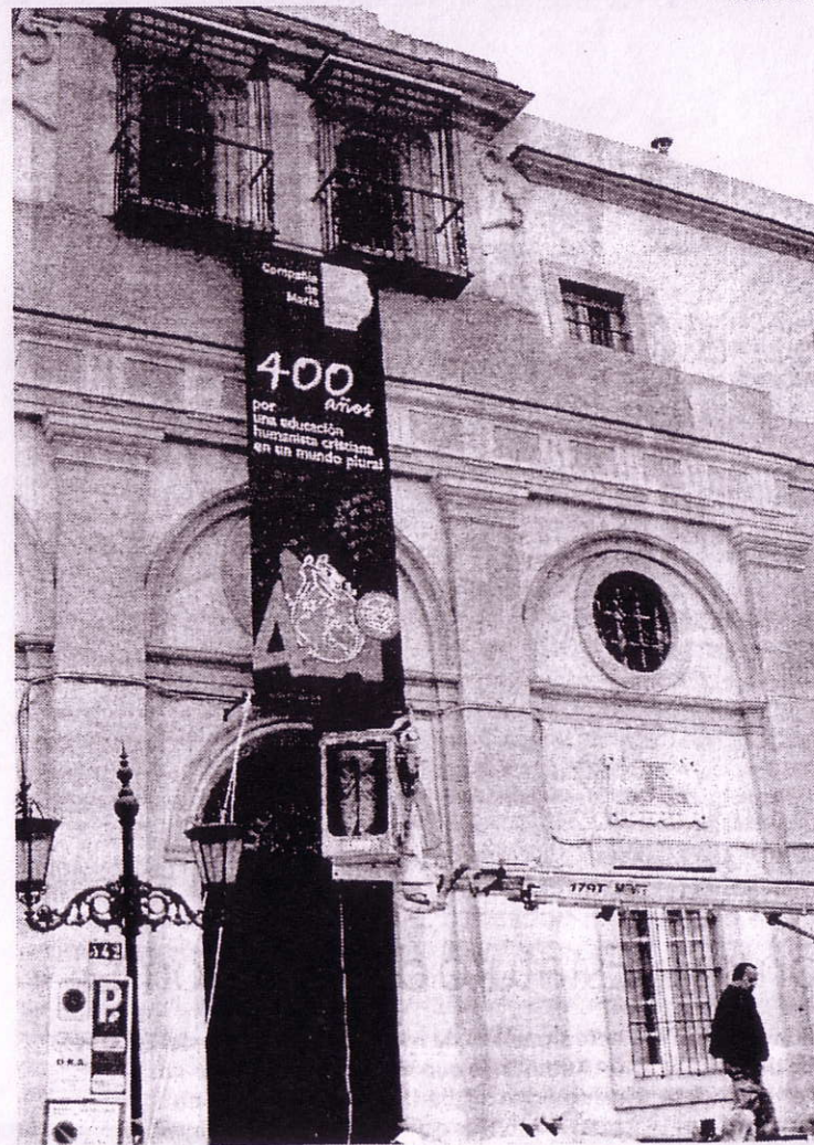
Operarios del Ayuntamiento colocaron una pancarta en la fachada.

En la fachada del colegio también se aprecia desde ayer por la tarde un gran cartel donde figura el logo de la efeméride del 400 aniversario. Operarios del Ayuntamiento ayudaron a colocar esta gran pancarta que hace público la efeméride de la comunidad de religiosas y educativa.